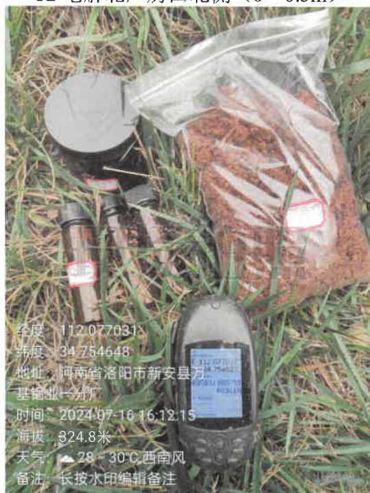
T4 电解北厂房东北侧 (0~0.5m)