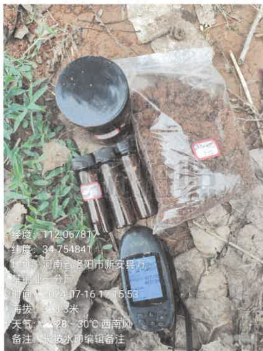
T13 厂区西侧 (0~0.5m)