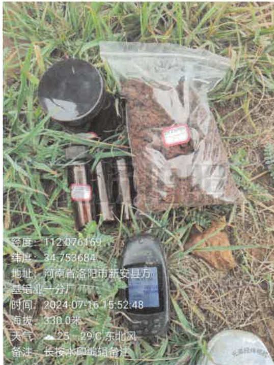
T7 电解南厂房东侧 (0~0.5m)