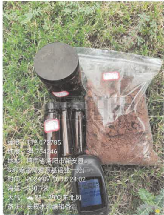
T6 电解南厂房南侧 (0~0.5m)