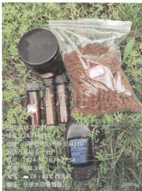
T2 电解北厂房西北侧 (0~0.5m)