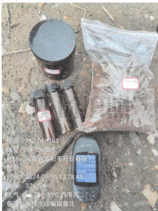
T1 参照点 (0~0.5m)