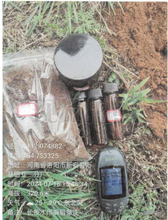
T8 氧化铝仓库西南侧 (0~0.5m)