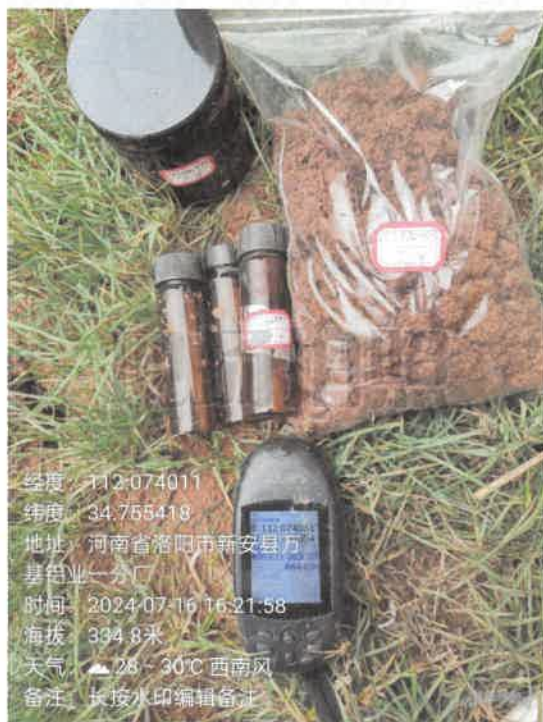
T14 厂区北侧 (0~0.5m)