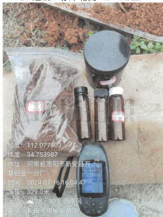
T11 厂区东侧 (0~0.5m)