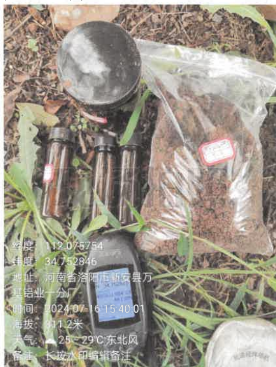
T9 危废贮存库北侧 (0~0.5m)