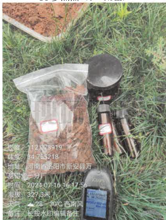
T3 电解北厂房北侧 (0~0.5m)