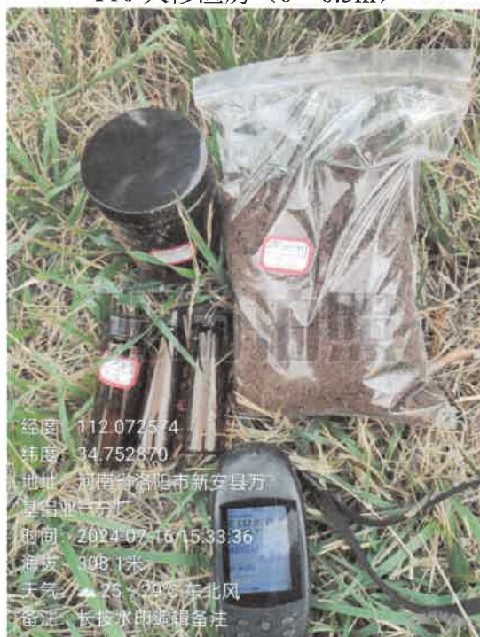
T12 厂区南侧 (0~0.5m)