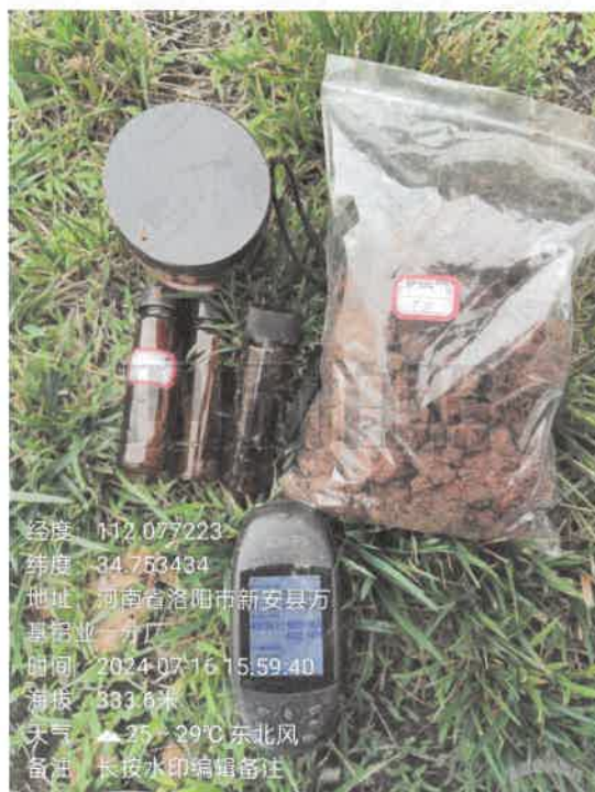
T10 大修渣房 (0~0.5m)