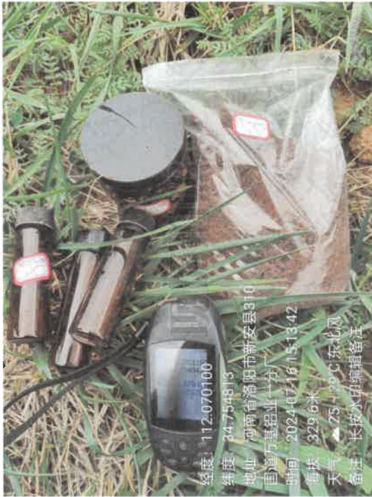
T5 电解南厂房西南侧 (0~0.5m)